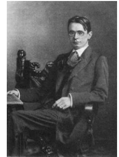
Dr. Rudolf Steiner

die Soziale Dreigliederung Rudolf Steiner